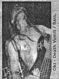
Oki - Death Vomit / Bass.